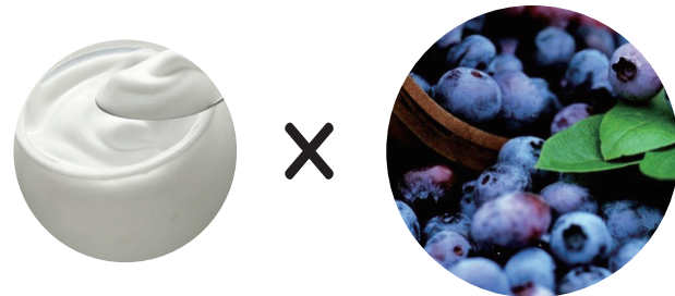
ヨーグルト × ブルーベリー