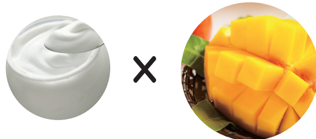
ヨーグルト × マンゴー