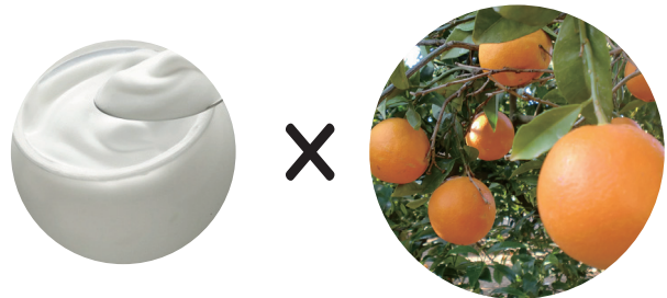
ヨーグルト × オレンジ